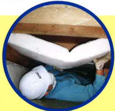
床下での断熱材設置作業のようす

床をはがさないから短期間であしん施工。 施工後は、足元までぬくもりの行き届く、 暖房効率のよい暖かいお部屋で過ごせます!