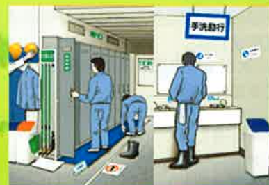
更衣室・洗面場など