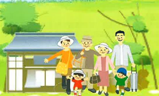
旅館・ホテルなどの公共設備