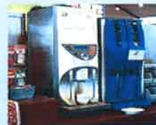
ドリンクバー周辺