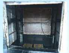
フードエレベーター