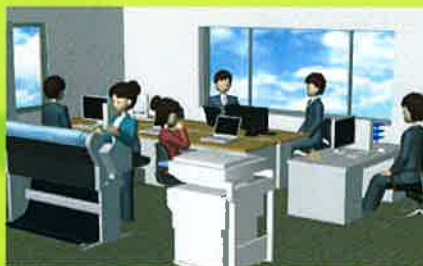
オフィス・会議室など