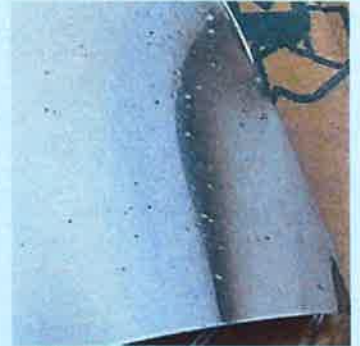
他製品噴霧直後 (処理面の表面に油膜が残る)