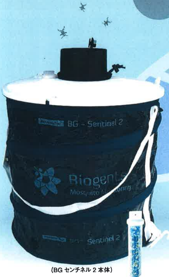
(BG センチネル 2 本体)